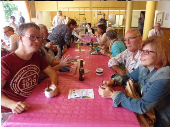
Autour des tables